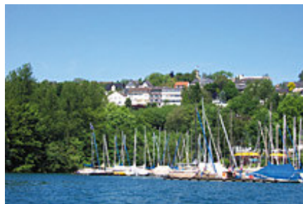
Bildungszentrum Sorpesee der VHS Hochsauerlandkreis

The event is in accordance with tradition of the RD Clinics in Eringerfeld.